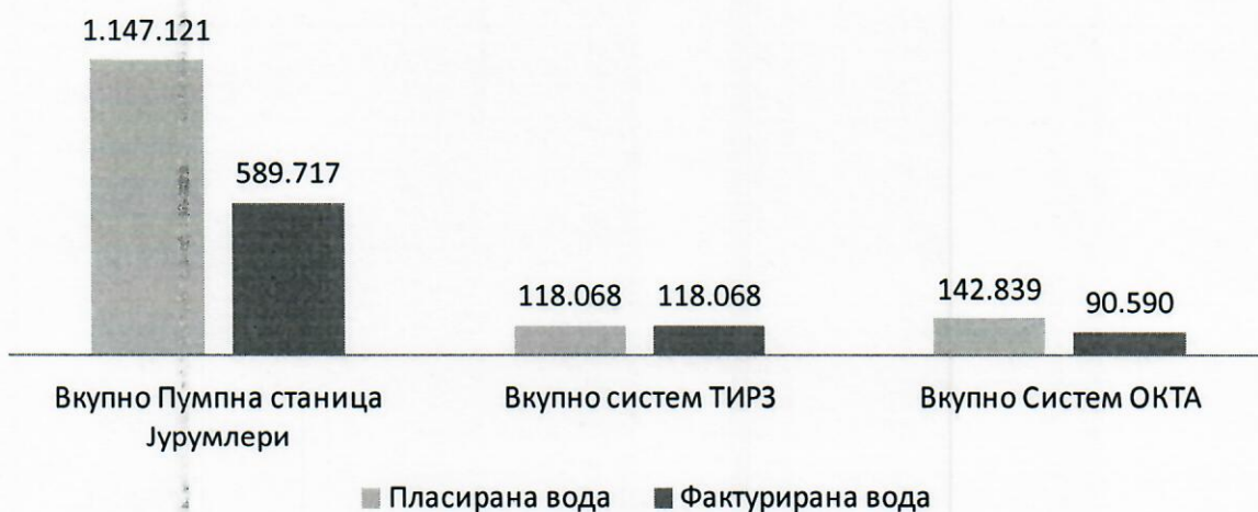
График 3: Вкупно пласирана и фактурирана вода прикажано по системи (m 3 )

Во моментот ЈКП „Водовод“ н.Илинден врши експлоатација на вода од три водоводни системи, систем Јурумлери, систем ОКТА и систем ТИРЗ. Од водоводниот систем Јурумлери со вода се снабдуваат населените места Илинден, Марино, Кадино, Мралино, Ајватовци, Бунарџик, Бучинци од општина Илинден, Гоце Делчев, Јурумлери, м.в. Драма и Идризово од општина Гази Баба како и населените места Петровец, Огњанци, Р’жаничино и Којлија од општина Петровец. Од водоводниот систем ОКТА со вода се снабдуваат населените места Миладиновци, Бујковци, Текија и Дељадровци. Водата од системот ТИРЗ е наменета за водоснабдување на правните субјекти од ТИРЗ Скопје 1 и Скопје 2.